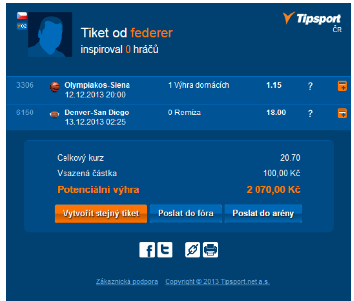
Nová podoba opisu tiketu